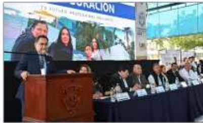
Se ha tenido la visita de otros subsistemas del Nivel Medio Superior

Al día 7 de febrero, se han atendido 29 UAP y sus extensiones, con un alcance de 33, 259 estudiantes.