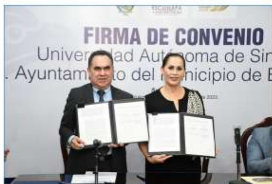
Lic. Blanca Estela García Sánchez Presidenta Municipal de Escuinapa