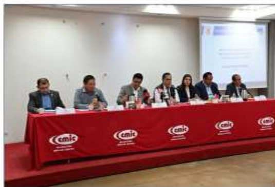
Culiacán 15 y 16 de marzo