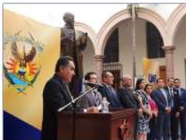
Guardia de honor en monumento al Lic. Eustaquio Buelna Pérez