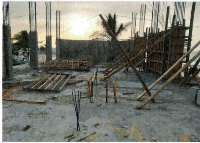
1.- COLADO DE LOSA PLANTA BAJA