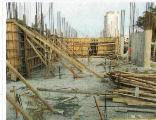
CIMBRADOS DE MURO DE CONCRETO PRIMER NIVEL