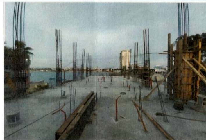
COLADO DE COLUMNAS DE PRIMER NIVEL