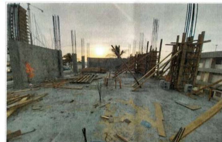
CIMBRADO DE COLUMNAS